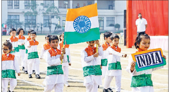
बहादुरगढ़। खेल दिवस के दौरान मार्चपास्ट प्रस्तुत करते नई विद्यार्थी।

उन्होंने विद्यार्थियों को खेल भावना, अनुशासन और टीम वर्क के महत्व पर प्रेरक संदेश दिया। सभी स्टाफ सदस्यों ने भी आयोजन को सफल बनाने में अपना पूर्ण योगदान दिया।