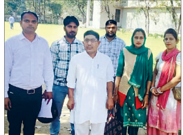
झज्जर। लघु सचिवालय परिसर में उपस्थित एलसीएलओ कर्मचारी।