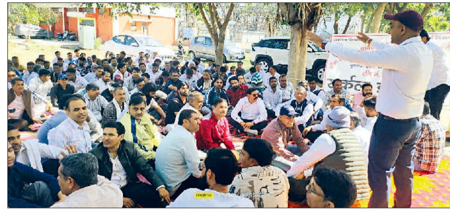
झज्जर। विरोध प्रदर्शन के दौरान उपस्थित बिजली निगम कर्मचारी।