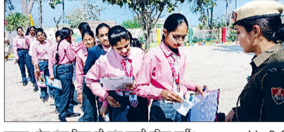
झज्जर। रोल नंबर रिलीफ की जांच करती पुलिस कर्मी।