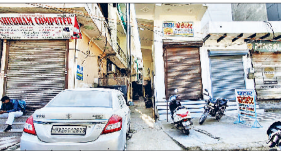
झज्जर। बीकानेर चौक के नजदीक बंद पड़ी फोटोस्टेट की दुकानें।