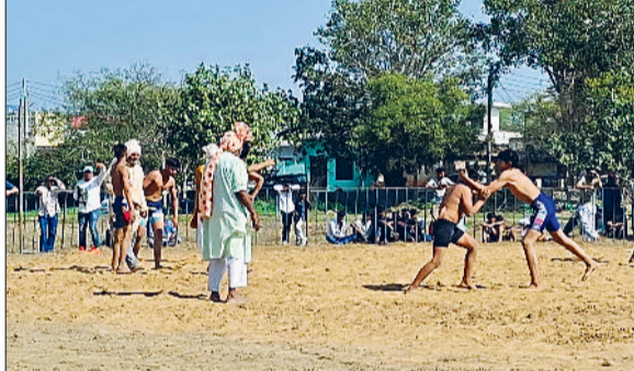
झज्जर। दंगल में अपना जोर आजमाते हुए नई पहलवान।

हवन व विशेष पूजा-अर्चना के साथ की गई। बाद में शुरू हुए भंडारे में सैकड़ों श्रद्धालुओं ने प्रसाद ग्रहण किया। इसके अलावा गांव के खेल मैदान में कुश्ती दंगल का आयोजन किया गया। कुश्ती दंगल में अनेक छोटी-बड़ी इनामी कुश्तियां कराई