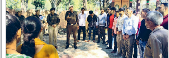
झज्जर। स्वयंसेवकों को संबोधित करते हुए दुर्गा शक्ति पुलिस टीम के सदस्य।