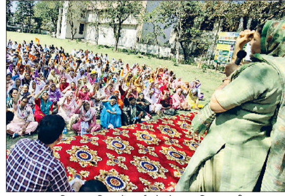
झज्जर। लघु सचिवालय परिसर में प्रदर्शन के दौरान उपस्थित भारतीय मजदूर संघ से संबंधित संगठनों के कर्मचारी।