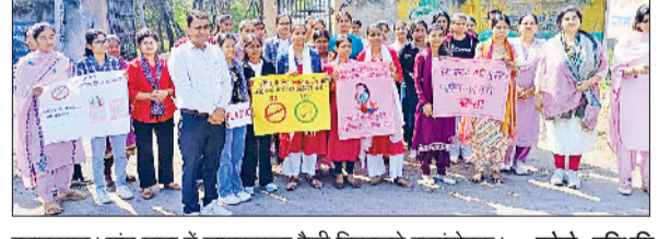
बहादुरगढ़। गांव छारा में जागरूकता रैली निकालते स्वयंसेवक।

कैंप के छठे दिन स्वयंसेवकों ने नुककड़ नाटक किया और जागरूकता रैली निकाली