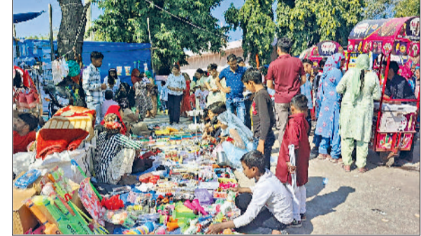
झज्जर। मेले में खरीददारी करती महिलाएं।

हवन व विशेष पूजा-अर्चना के साथ की गई। बाद में शुरू हुए भंडारे में सैकड़ों श्रद्धालुओं ने प्रसाद ग्रहण किया। इसके अलावा गांव के खेल मैदान में कुश्ती दंगल का आयोजन किया गया। कुश्ती दंगल में अनेक छोटी-बड़ी इनामी कुश्तियां कराई