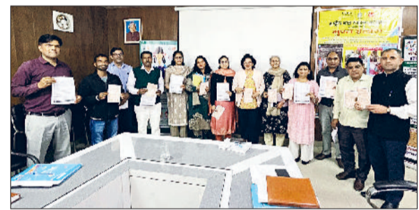
झज्जर। बैठक में उपस्थित स्वास्थ्यकर्मी व अधिकारी।