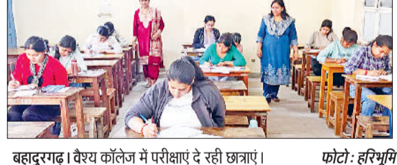
बहादुरगढ़। वैश्य कॉलेज में परीक्षाएं दे रही छात्राएं।